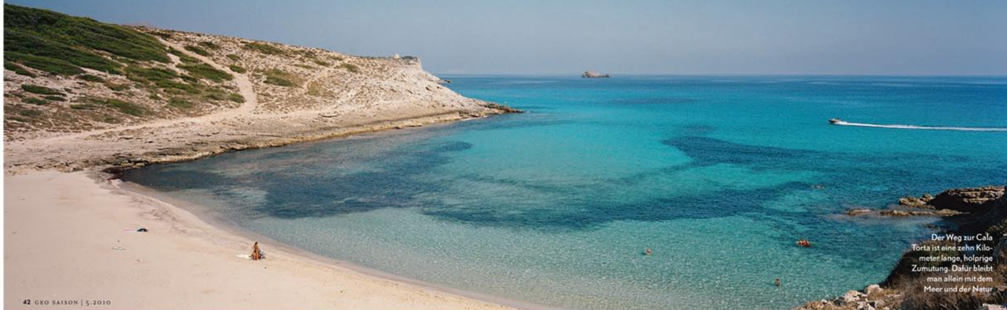
Der Weg zur Cala Torta ist eine zehn Kilometer lange, holprige Zumutung. Dafür bleibt man allein mit dem Meer und der Natur

■ CALÓ DES MÀRMOLS. Eine gute Stunde dauert die Wanderung vom Leuchtturm am Cap de ses Salines (nach links mit dem Blick zum Meer), immer an der Küste entlang, über Felsen und Klippen, durch einen trockenen Flusslauf, dann hinunter an die Bucht. Der Sand ist wie Seide, das Wasser eine Wonne, fast unwirklich klar. Wer nicht ganz so weit gehen will: Vom Leuchtturm aus nach rechts erreicht man auf einem einfachen Wanderweg in einer halben Stunde den ■ PLATJA D'ES CARAGOL , einen langen weißen Sandstrand mit Dünen.