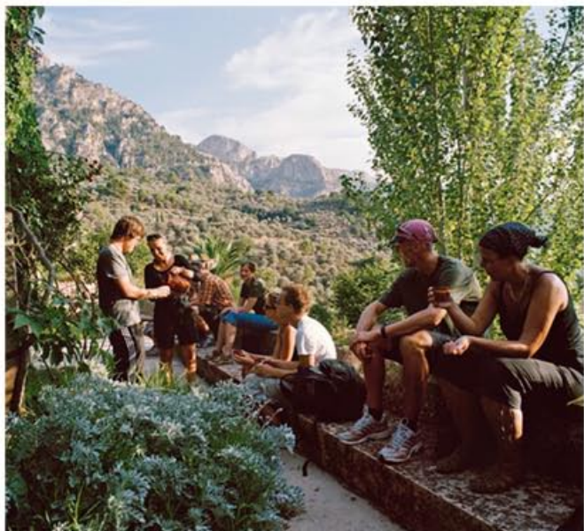
Rotwein aus dem Steinkrug gibt's nach der Wanderung auf einer Finca

Schlucht liegen, als hätte ein wütender Riese sie hineingeschleudert. Manchmal scheint es uns schlicht unmöglich, noch einen Schritt weiterzukommen.