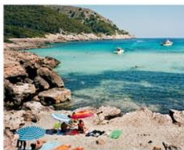
Sympathische Saboteure: Weil Fans der Bucht beharrlich Wegweiser abmontieren, bewahrt die Cala Varques ihre Schönheit