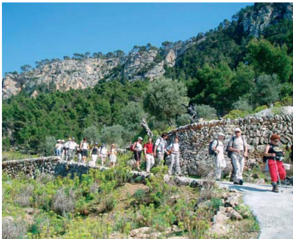
Pas des Pi

En el pasado 2009 nuestro veterano Grupo ha continuado dinamizando todas las actividades iniciadas en los pasados años con objeto de adaptarlas al siglo XXI, lo que representa un reto cada vez más interesante, ello sin olvidar los fundamentos que motivaron su creación, más bien ampliándolos en todo aquello que sea beneficioso.